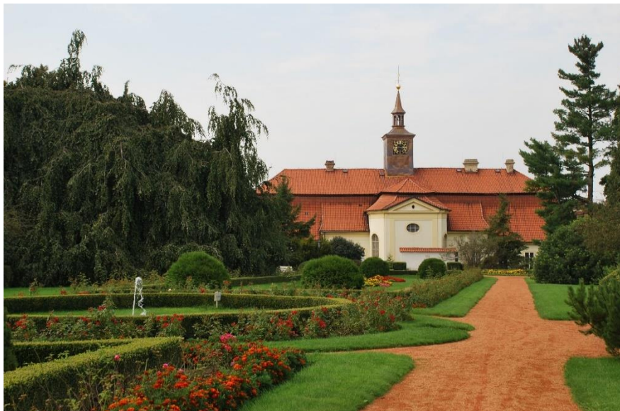
Zámecká zahrada v Chrasti

Proti švábům bude nasazena inovativní metoda likvidace. Za tímto účelem byli sezváni na svatého Štěpána orientační běžci